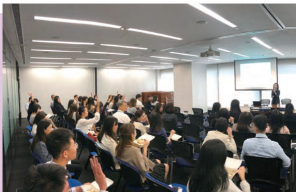
證姿蒼舉辦的退休規劃工作坊

我們組織員工到訪北京及上海的監管機構，並與相關部門合辦工作坊。年內，按照本會與中國證監會的諒解備忘錄下的安排，有一名本會的員工獲借調至中國證監會，另有兩名中國證監會人員獲調派至本會工作。